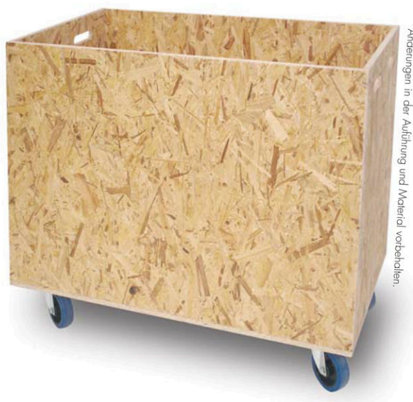
Änderungen in der Ausführung und Material vorbehalten.

innenliegender Deckel (mit Auflage-Kranz) aus 15 mm OSB verschraubbarer Deckel mit vorgebohrten Löchern Klappdeckel mit Öffnungsbegrenzung (auf Wunsch mit Überwurfriegel)